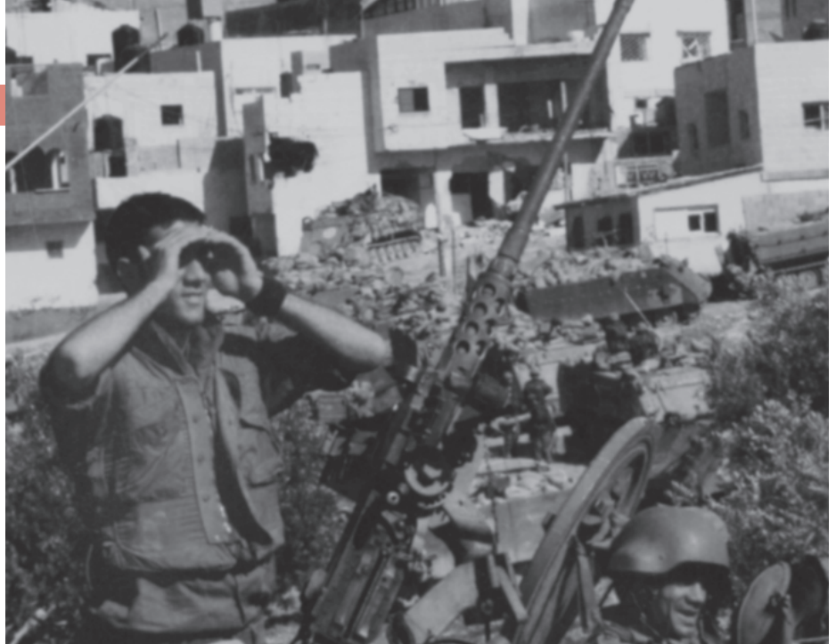
חיילי צה"ל בנ"ל במהלך מבצע חומת מגן | כתיבת הספר היא דרך להתמודד עם חוויות הקרב, עם האובדן ועם הצורך להנציח את האירועים ואת החברים