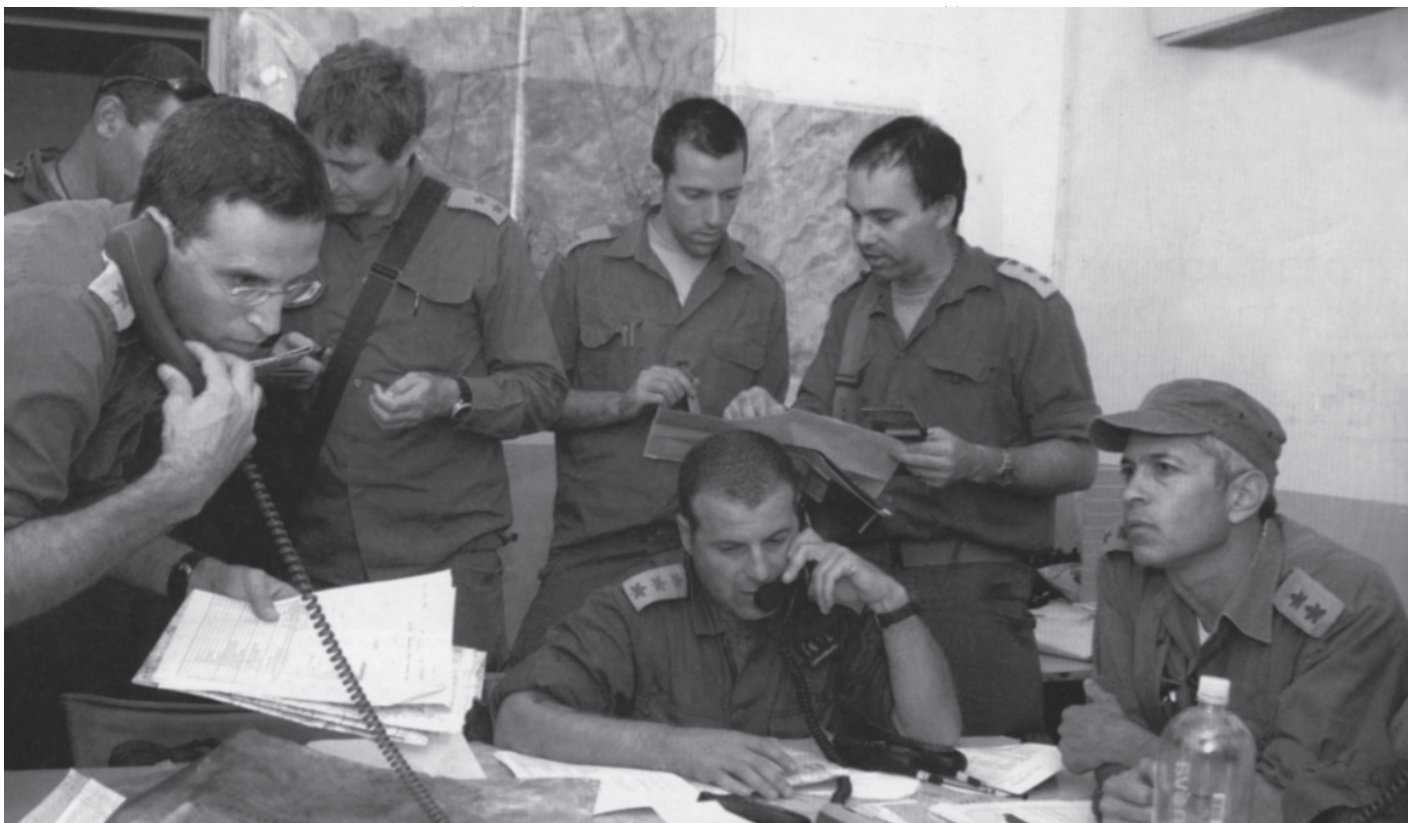
מפקדי חטיבת אלכסנדרוני בחמ"ל, מלחמת לבנון השנייה | מערך המילואים נקרא פעם אחר פעם להגן על מדינת ישראל, אך אף שברור כי אי-אפשר להסתדר בלעדיו, עולה בברור מהספר "חומת מן שלי" שהוא הפך למעין בן חורג ומקופח בצבא