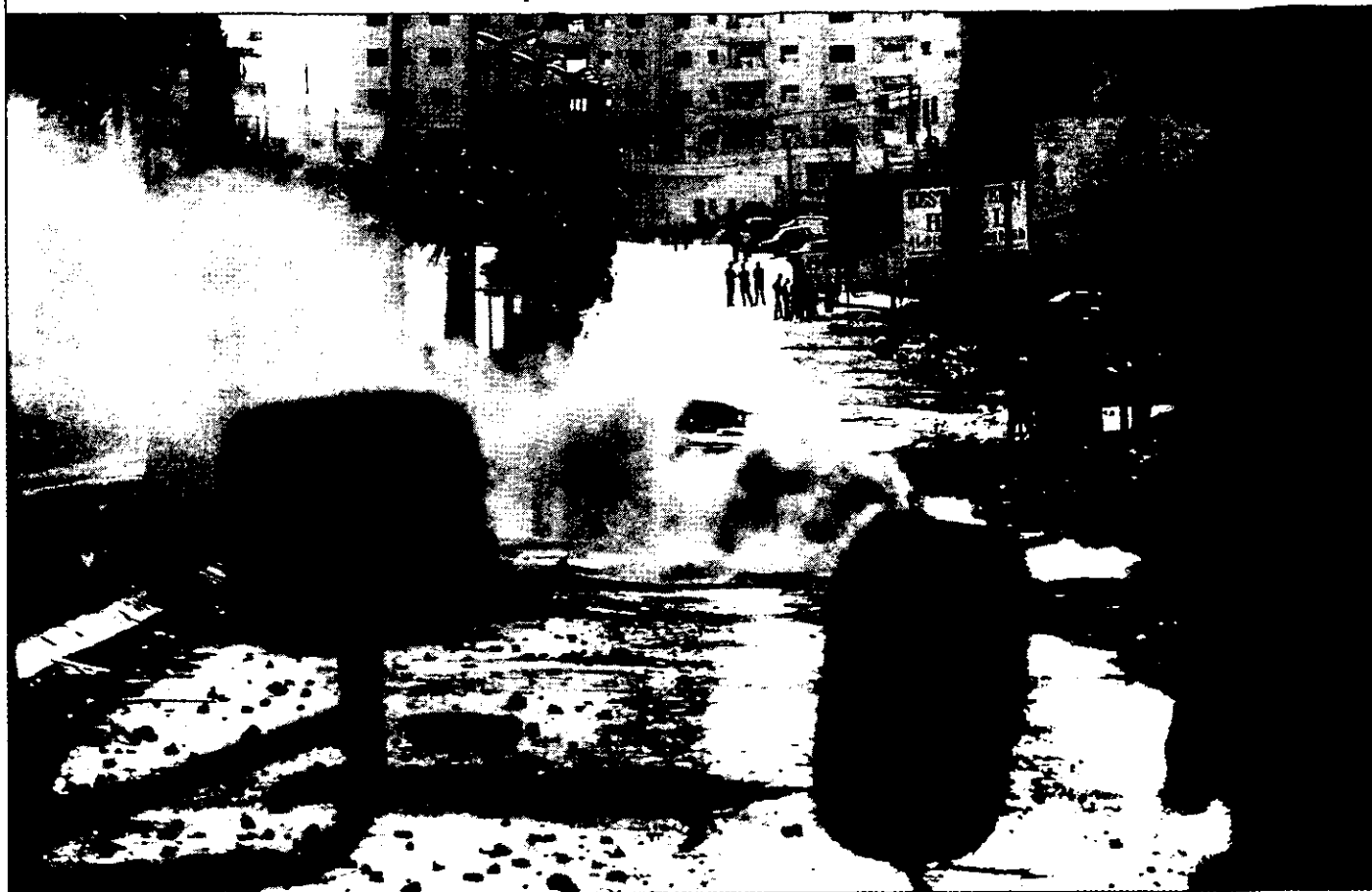
שיעור היירוט המדהים שהשיגו כוחות הביטחון של ישראל נובע, בתוך שאר הדברים, מכך שחזרו לפעול בתוך ערי הפלסטינים וכפריהם

שירותי הביטחון של ישראל לשבחים על גילויים וחשיפתם של כ-90% ממעשי הטרור שתיכננו הפלסטינים - הישג מדהים על-פי כל קנה מידה. ועם זאת, הישג כגון זה מאבד כל משמעות שעה שכישלון כלשהו במניעת פעולה של מגה-טרור בלתי קונוונציונלי עלול להתבטא בהרס איום. נוכח סיכוי שכזה ההרתעה הישראלית חסרת משמעות באותה המידה. כמו שכבר ציינתי קודם, זוהי הבעיה הביטחונית המתסכלת של תקופתנו בכללותה. אלא שהיא נוגעת עוד יותר לישראל, שיישובה הקטן מרוכז בעיקרו ברצועת החוף הצרה, שרוחבה 15-30 ק"מ, וכמעט אין כל חציצה בינה לבין השטח הפלסטיני.